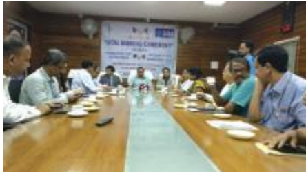
ସୂଚନା କେନ୍ଦ୍ର (ଏନଆଇସି) ପକ୍ଷରୁ ପ୍ରସ୍ତୁତ ଏହି ସଫ୍ଟୱେର ପଞ୍ଚାୟତରାଜ ବିଭାଗର ବିଭିନ୍ନ

ଚତୁର୍ଥ ରାଜ୍ୟ ଅର୍ଥ କମିଶନ ଓ ଚତୁର୍ଦ୍ଦଶ କେନ୍ଦ୍ରୀୟ ଅର୍ଥ କମିଶନ ଅନୁଦାନଭିତ୍ତିକ ବିଭିନ୍ନ ଯୋଜନାର ଅଗ୍ରଗତି ସମ୍ପର୍କରେ ସମୀକ୍ଷା ତଥା ନିର୍ଭୁଲ ହିସାବ ରକ୍ଷା ପାଇଁ ଆକୃନ୍ ସପ୍ଟ ଆପ୍ଲିକେସନ୍ ବ୍ୟବହାର ପାଇଁ ରାଜ୍ୟ ସରକାରଙ୍କ ପଞ୍ଚାୟତରାଜ ବିଭାଗ ଏବଂ ଷ୍ଟେଟ ବ୍ୟାଙ୍କ୍ ଅଫ୍ ଇଣ୍ଡିଆ ମଧ୍ୟରେ ଏପ୍ରିଲ ୨୧ ତାରିଖରେ ଏକ ବୁଝାମଣାପତ୍ର ସ୍ୱାକ୍ଷରଣ ହୋଇଛି । ଜାତୀୟ