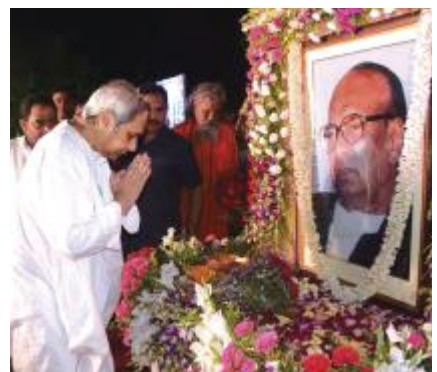
ବିଜୁ ବାବୁଙ୍କ ଶ୍ରାଦ୍ଧାର୍ଚ୍ଚନାରେ ମୁଖ୍ୟମନ୍ତ୍ରୀ ଶ୍ରୀ ନବୀନ ପଟ୍ଟନାୟକ ଶ୍ରଦ୍ଧାଞ୍ଜଳି ଅର୍ପଣ କରୁଛନ୍ତି

ବିପର୍ଯ୍ୟୟ ପରିଚାଳନାରେ ଓଡ଼ିଶା ସାରା ବିଶ୍ୱରେ ମଡେଲ୍ ହୋଇଛି ବୋଲି ମୁଖ୍ୟମନ୍ତ୍ରୀ ଶ୍ରୀ ନବୀନ ପଟ୍ଟନାୟକ କହିଛନ୍ତି । ପ୍ରାକୃତିକ ବିପର୍ଯ୍ୟୟରେ ରାଜ୍ୟର ଜନଜୀବନ କ୍ରମାଗତ ଭାବେ ବିପୁଳ କ୍ଷତି ସହି ଆସୁଥିବା ବେଳେ ଏ କ୍ଷେତ୍ରରେ ସରକାରଙ୍କ ଅଭିନବ ପ୍ରୟାସ ସାରା ବିଶ୍ୱରେ ପ୍ରଶଂସିତ ହୋଇଛି ।